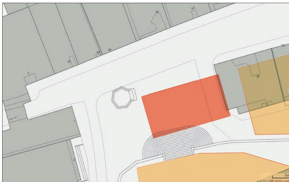
Übersicht zur mittelalterlichen Situation am Chileplatz gemäss den archäologischen Befunden. Orange: bisher archäologisch erfasste mittelalterliche Häuserzeilen östlich und südlich des Chileplatzes. Rot: hypothetische Ausdehnung der in der Grabung 2012 erfassten Markthalle aus der Zeit um 1300. Grafik Kantonsarchäologie Luzern

und Peter Eggenberger vorgelegten Rekonstruktionen der mittelalterlichen Bebauung liefern. Die Grabung Chileplatz und die beiden im Frühling 2012 angelegten Sondierungen vor den Häusern Hauptgasse 11 und 19 zeigen, dass die südliche Fassadenlinie der Hauptgasse mindestens bis zu den Stadtbränden im späten 14. Jahrhundert anders verliefen, als dies heute der Fall ist: Während die mittelalterliche Gassenflucht auf Höhe des Chileplatzes rund zwei Meter hinter dem heutigen Platzrand lag, die Hauptgasse also etwas breiter war, scheint sie gegen Osten hin schmaler geworden zu sein. Im Bereich der Häuser Hauptgasse 11 und 19 jedenfalls ragte die südliche mittelalterliche Häuserzeile offenbar weiter in die heutige Gasse vor. Durch diese vorgeschobene Fassa-