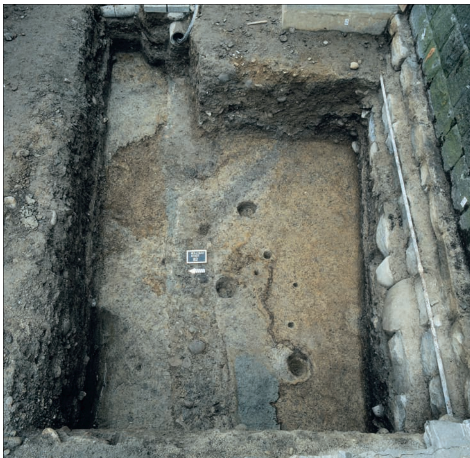
Am Fuss der Kirchhofmauer zeichnen sich in einer Grabungsfläche von 1995 verschiedene Pfosten- und Staketenlöcher ab, welche von der Besiedlung Willisau vor der Stadtgründung zeugen.