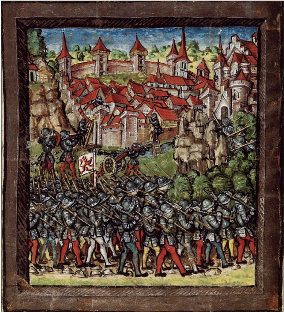
Diebold Schilling zeigt in seiner Luzerner Chronik die Zerstörung der – phantasievoll ausgestalteten – Stadt Willisau durch die habsburgisch-österreichischen Truppen 1386. Man beachte unter anderem die spätmittelalterliche Qualität der Strasse im Vordergrund, welche mit ihrer Festigung aus grossen Steinen eine recht holprige Angelegenheit dargestellt haben dürfte.