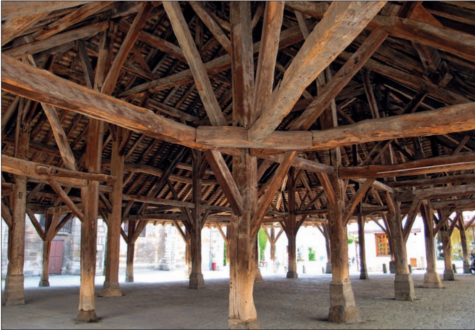
Im burgundischen Städtchen Nolay hat sich eine Markthalle aus dem 14. Jahrhundert erhalten. Eine ähnliche Konstruktion darf auch für das nach der Stadtgründung auf dem Chileplatz errichtete Marktgebäude angenommen werden.