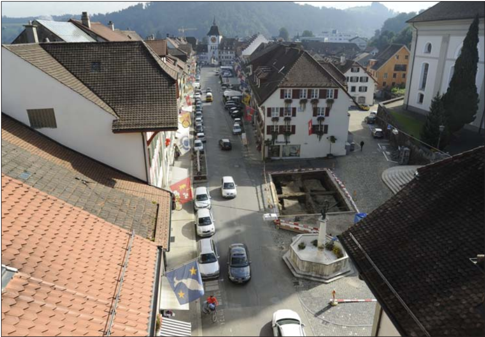
Willisau im September 2012 mit der Grabungsfläche auf dem Chileplatz, beim Ende der Ausgrabung. Blick vom Obertor über die Hauptgasse zum Untertor.