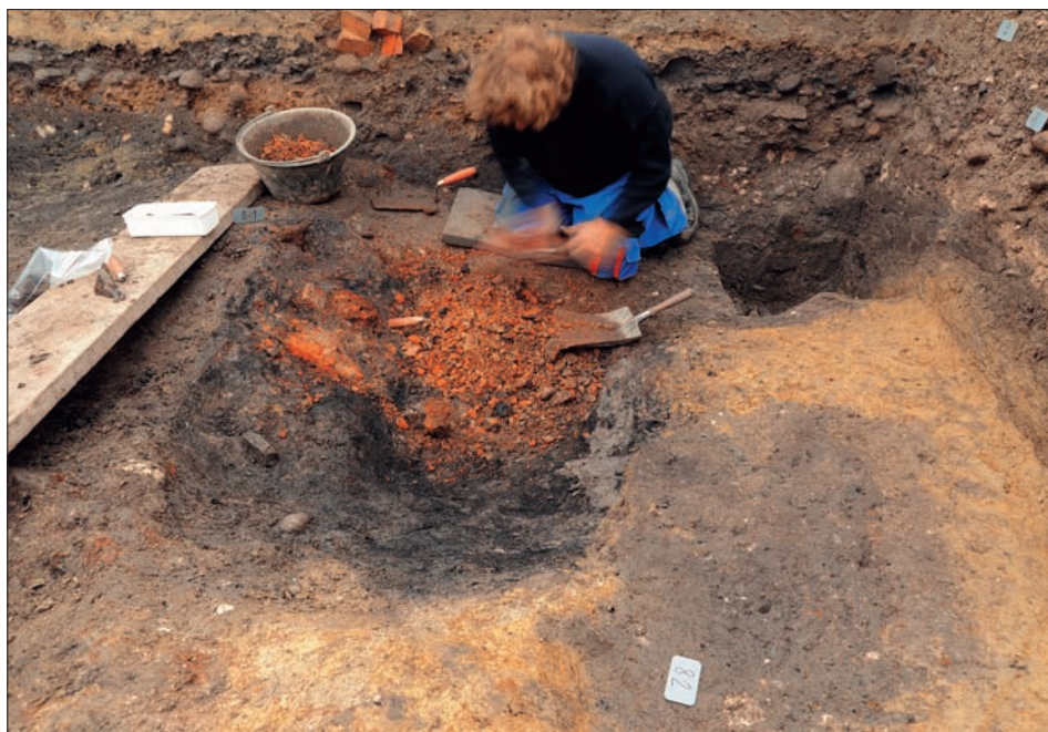
Freilegen einer mit Brandresten verfüllten Werkgrube unter dem Chileplatz: Zahlreiche Bodeneingriffe zeugen von intensiver handwerklicher Tätigkeit im vor der Stadtgründung bestehenden Dorf Willisau.