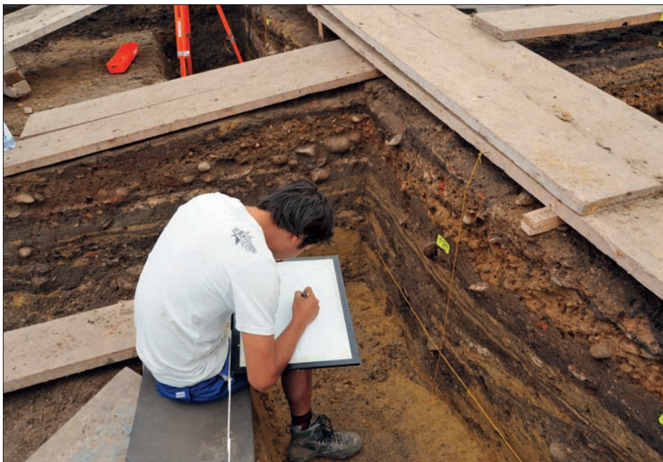
Dokumentation der komplexen archäologischen Strukturen am Chileplatz. Die hier sichtbare reiche Schichtabfolge spiegelt mehrere Hundert Jahre Willisauer Geschichte. Zum grössten Teil stammt sie vom vorstädtischen Dorf Willisau.

den jedoch auch in kleinen Sondierungen augenfällig. Ein solcher Prozess ist die Stadtwerdung Willisaus in der Zeit der Gründung um 1300. Diese äussert sich in weitflächigen Planien, welche bisher bei zahlreichen Grabungen in der Stadt festgestellt werden konnten. Die Unebenheiten des Dorfgeländes wurden ausgeglichen und mit einer Schicht aus Kies überschüttet. Ganz offensichtlich orientierten sich die neuen städtischen Strukturen nicht an den bestehenden: Wir müssen davon ausgehen, dass bei der planmässigen Umgestaltung des Geländes auch die dörfliche Bebauung – bis auf wenige Ausnahmen wie die Kirche – systematisch abgebrochen und die so genannten Hofstätten auf einer verdichteten Parzellierung neu errichtet wurden. Anstelle des Dorfes entstand